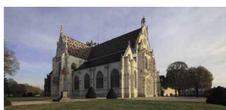
BOURG-EN-BRESSE (À 30 KM)

Réservation conseillée auprès du restaurant ou à l'accueil.