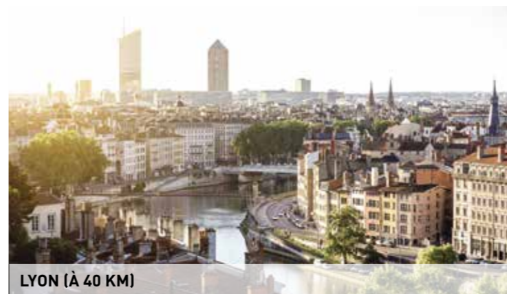
LYON (À 40 KM)

Pour organiser votre séjour dans l'Ain :