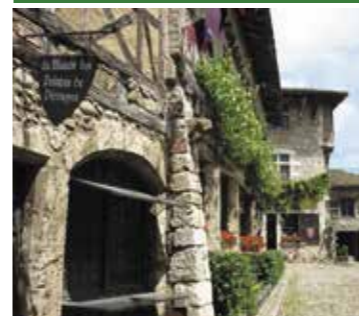
PÉROUGES (À 20 KM)