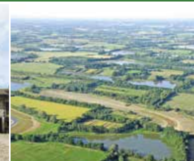
LES ÉTANGS DE LA DOMBES